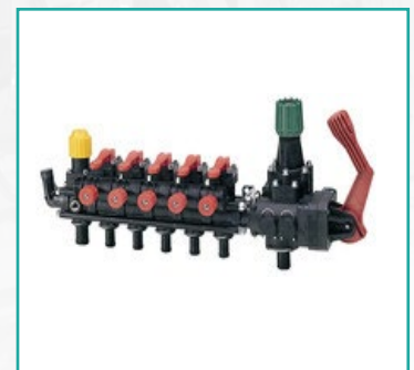
Proporcionalni distributor sa 5 izlaza Proportional distributor with 5 ways