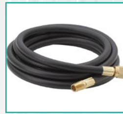
Crevo visokog pritiska High pressure hose