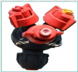
Tripleks dizne Trijet nozzles