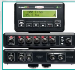
Kompjuter Bravo180 Computer Bravo180