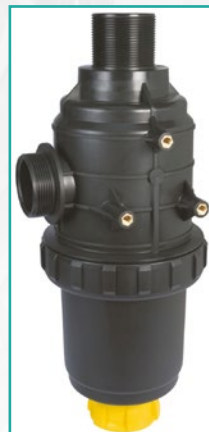
Filter za samopunjenje Intake filter predisposed for self-filling