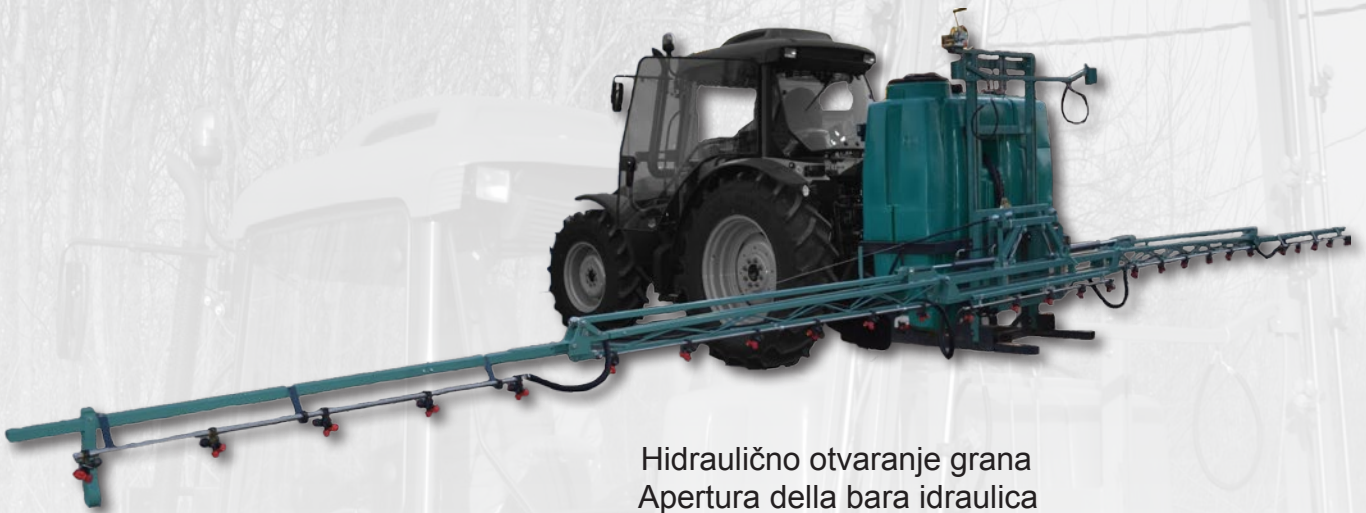
Hidraulično otvaranje grana Apertura della bara idraulica

Nardi mounted sprayers are highly specialized implements intended for agricultural use. They are special designed in order to provide the very best chemical protection in corp production, thanks to a series of technical innovation. Nardi produce the implements with a great care of enviroment and users of products and in this purpose have large number of different mounted sprayers with tank capacities ranging from 600 to 1200L, with best quality components, which, with their wide range of use, can meet the expectations of even the most demanding users.