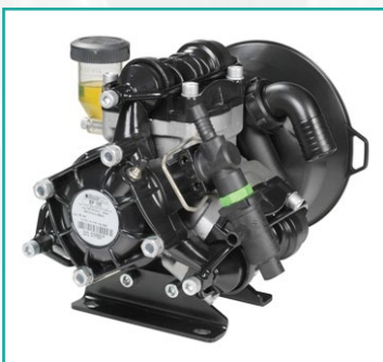
Membranska pumpa Diaphragm pump