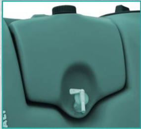
Rezervoar za pranje ruku Hand washing tank