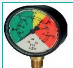
Merač pritiska Ø100 Pressure gauges Ø100