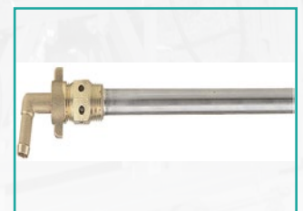
Cevasti hidromešač Tube agitator