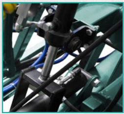
Hidraulična korekcija grana Hydraulic leveling booms