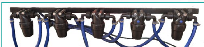
Linjski filteri Line filters