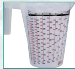
Bokal za testiranje mlaznice Nozzle check carafe