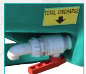
Ventil za totalno pražnjenje Total discharge valve