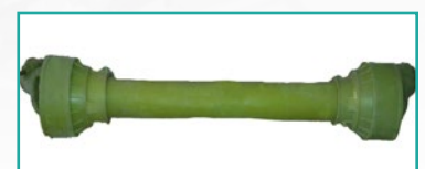
Kardansko vratilo PTO Shaft