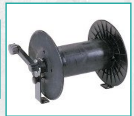
Motalica za crevo Hose reel