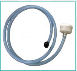
Sistem za samopunjenje Self filling kit