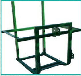
Toplo farbana šasija Hot painted steel frame