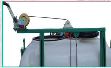
Čekrk sistem za podizanje grana Winch lifting the booms