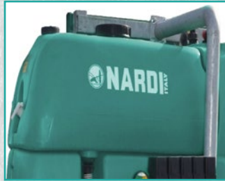
Rezervoar za pranje sistema Circuit washing tank