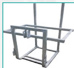
Cinkan ram Galvanized frame