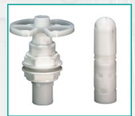
Set za pranje rezervoara Kit washing tank