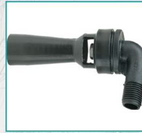
Hidromešač Hydraulic agitator