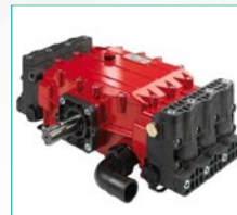
Klipna pumpa YA150 High pressure piston pump YA150