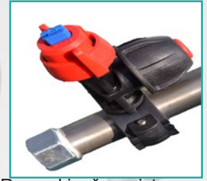
Rasprskivač sa sistemom protiv kapljanja Nozzle holder complete with nozzle and anti drop