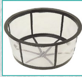
Sitasti filter Stainer filter